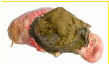
Pansen mit Inhalt