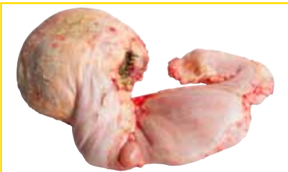
Lab- u. Blättermagen (Kugeln) voll