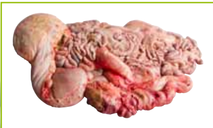
Darmpaket leer, jedes Alter