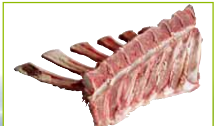
Wirbelsäule ohne Rückenmark