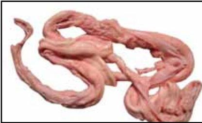
Rückenmark über 12 Monate