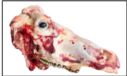
Oberkopf über 12 Monate